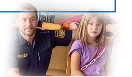
Anschnallen ist Pflicht!